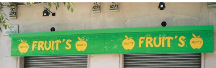
Plafones para locales de "FRUIT'S" en Barcelona, 2006.