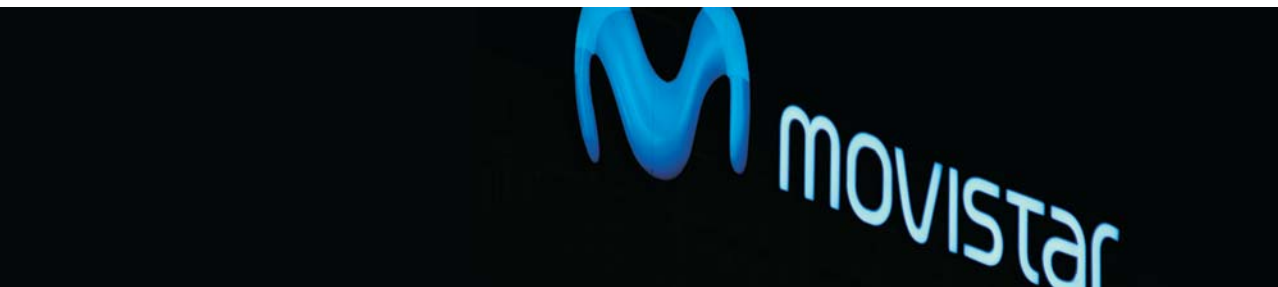
Cambio de imagen "MOVISTAR", Barcelona, Madrid, Valencia, La Coruña, 2006.