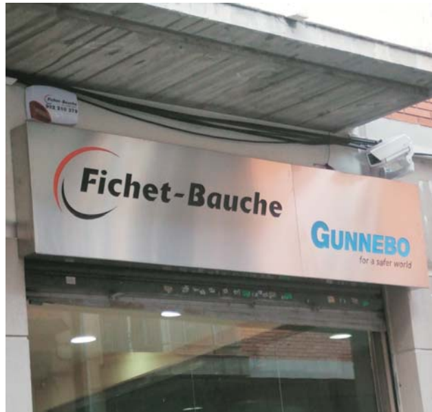
Cajón de acero inoxidable en sucursal de "FICHET" en Barcelona, Enero de 2007.