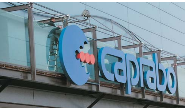
Rotulación exterior de los centros "CARRABO".