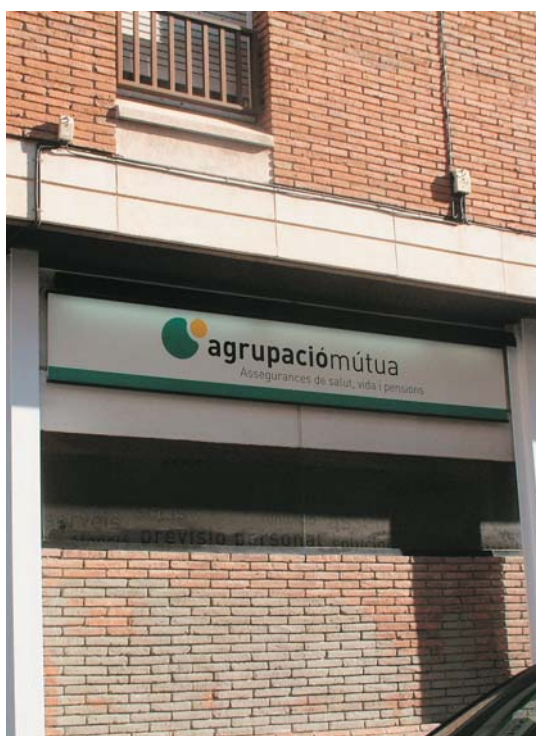
Cambio de imagen y apertura de nuevos centros de "AGRUPACIÓ MÚTUA".