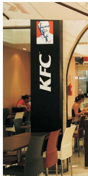
Rotulación interior "KFC", Palma de Mallorca.