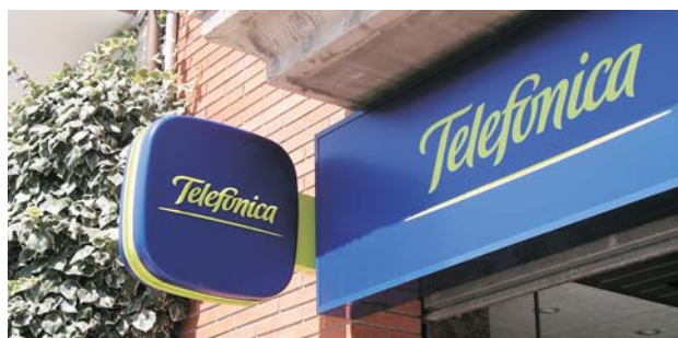
Montaje de 500 banderas "TELFÓNICA" en Península, Baleares, Canarias, Ceuta y Melilla, 2006.