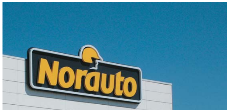
Fondo de bandejas mecanizadas con letras corpóreas "NORAUTO".