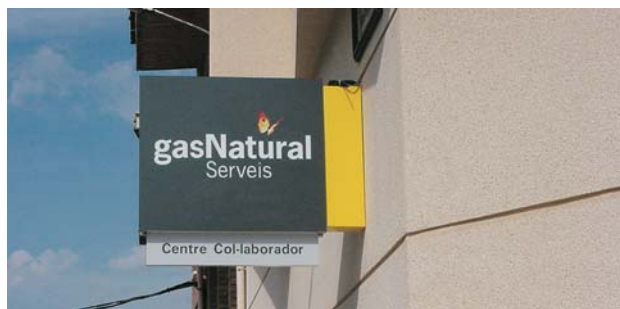
Banderas de metacrilato de "GAS NATURAL" para distribuidores.