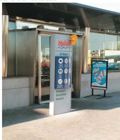
Tótem señalización área de servicio El Médol, Tarragona.