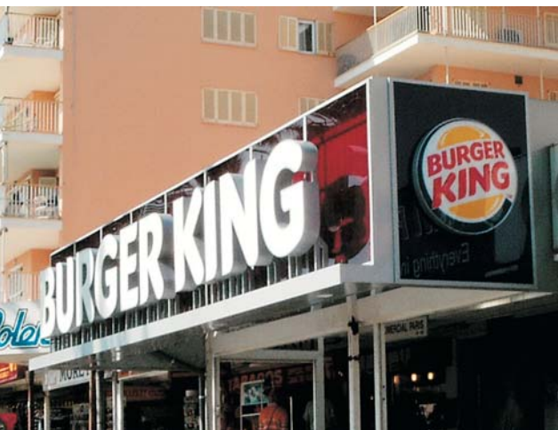
Rótulo de "BURGER KING" en S'Arenal de Palma de Mallorca, 2006.