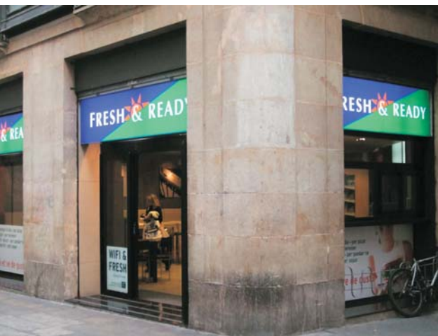
Local de "FRESH & READY" en Carrer Ferran de Barcelona, Diciembre 2006.