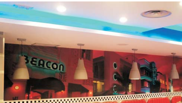
Impresión digital sobre vinilo para locales "BURGER KING".