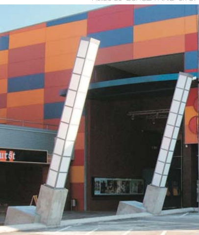
Columnas de luz para centro comercial El Vendrell, 2005.