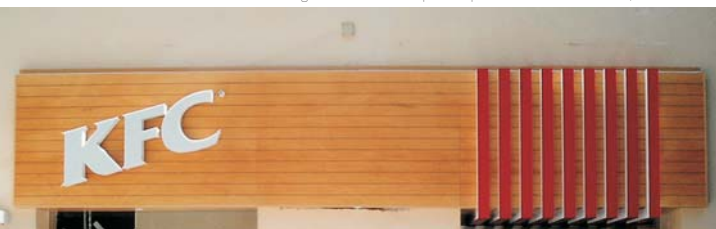
Plafón "KFC" de proforma mecanizado con letras corpóreas y bandas de metacrilato.