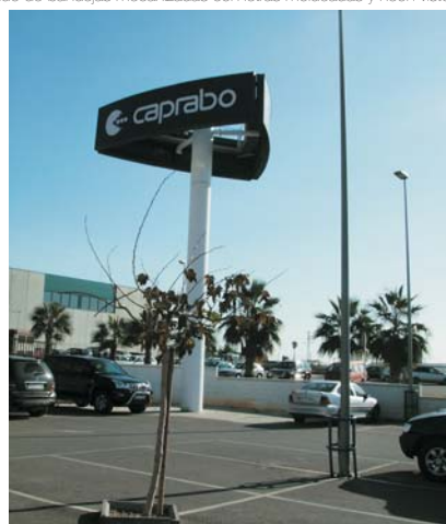
Tótem de 15 metros de altura "CAPRABO".