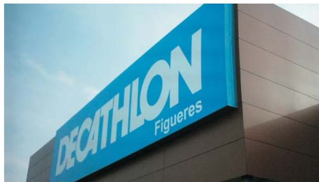
Cajones "DECATHLON" en Figueres, Platja d'Aro y Sant Pere de Ribes, primavera 2005.