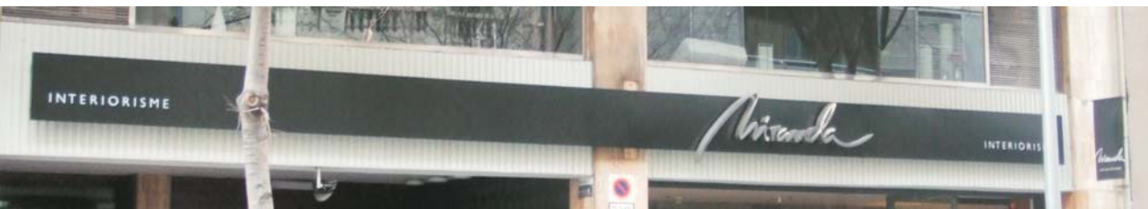
Conjunto de bandejas con iluminación contraluz y letras corpóreas de aluminio para tienda "MIRANDA INTERIORISME" de Barcelona, 2005.