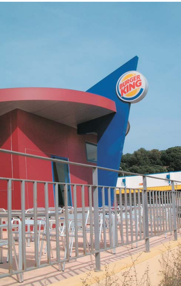
Handlebar "BURGER KING" de 9,09 x 4,86 metros.