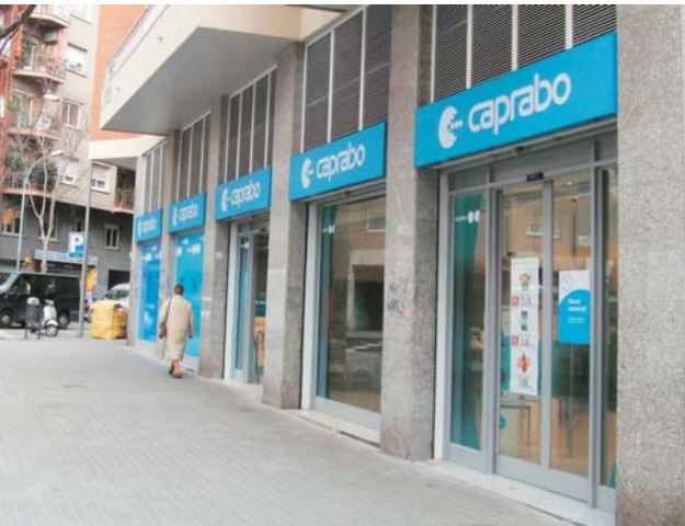
Cambio de imagen de "CAPRABO", desde Julio de 2006.