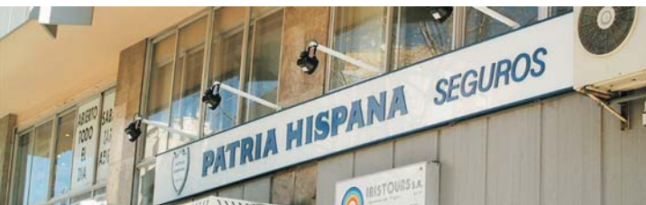
Plafones para "PATRIA HISPANA SEGUROS" en Madrid, Murcia, Palma de Mallorca y Vigo, 2006.