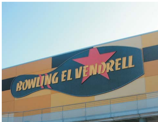
Fondo de bandejas mecanizadas con letras moldeadas y neón visto.