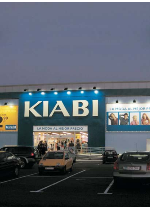
16 centros "KIABI" en la Península Ibérica, desde Agosto de 2005.