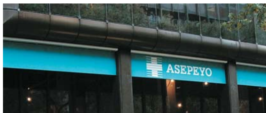
Rotulación de los centros "ASEPEYO" y "SOCIETAT DE PREVENCIÓ ASEPEYO".