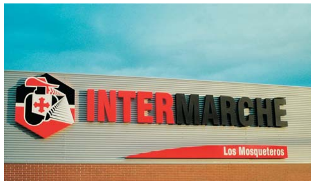
Rotulación exterior de los centros "INTERMARCHÉ".