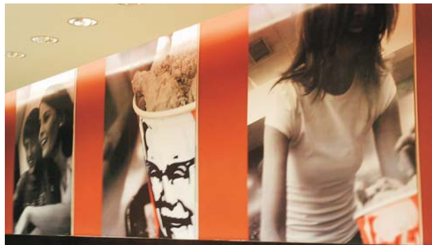
Impresión digital sobre vinilo para locales "KFC".