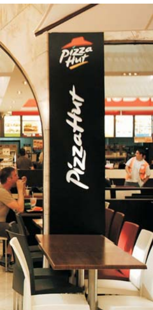
Rotulación interior "PIZZA HUT", 2006.