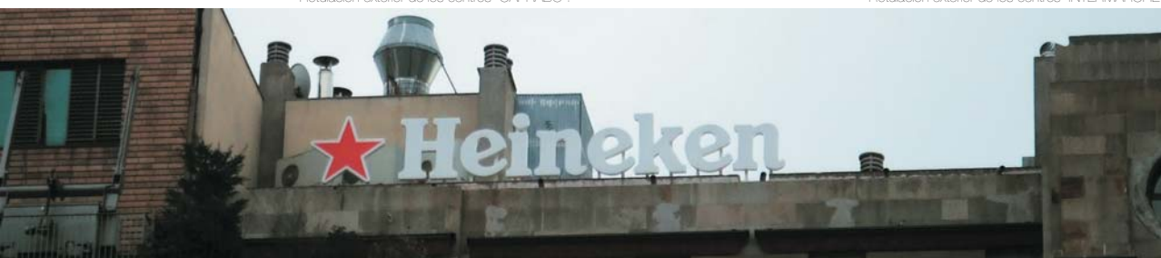
Rótulo "HEINEKEN" en Plaça Catalunya de Barcelona, Enero de 2007.